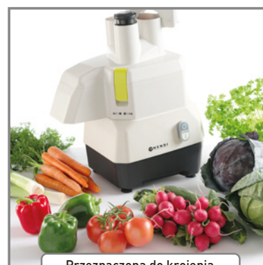
Przeznaczona do krojenia dużych ilości warzyw